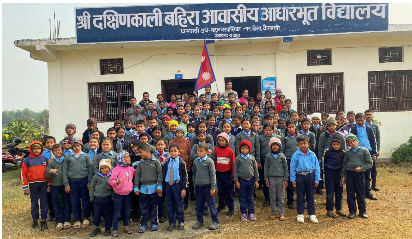
Elever och lärare utanför DAOKS dövskola i Nepal.