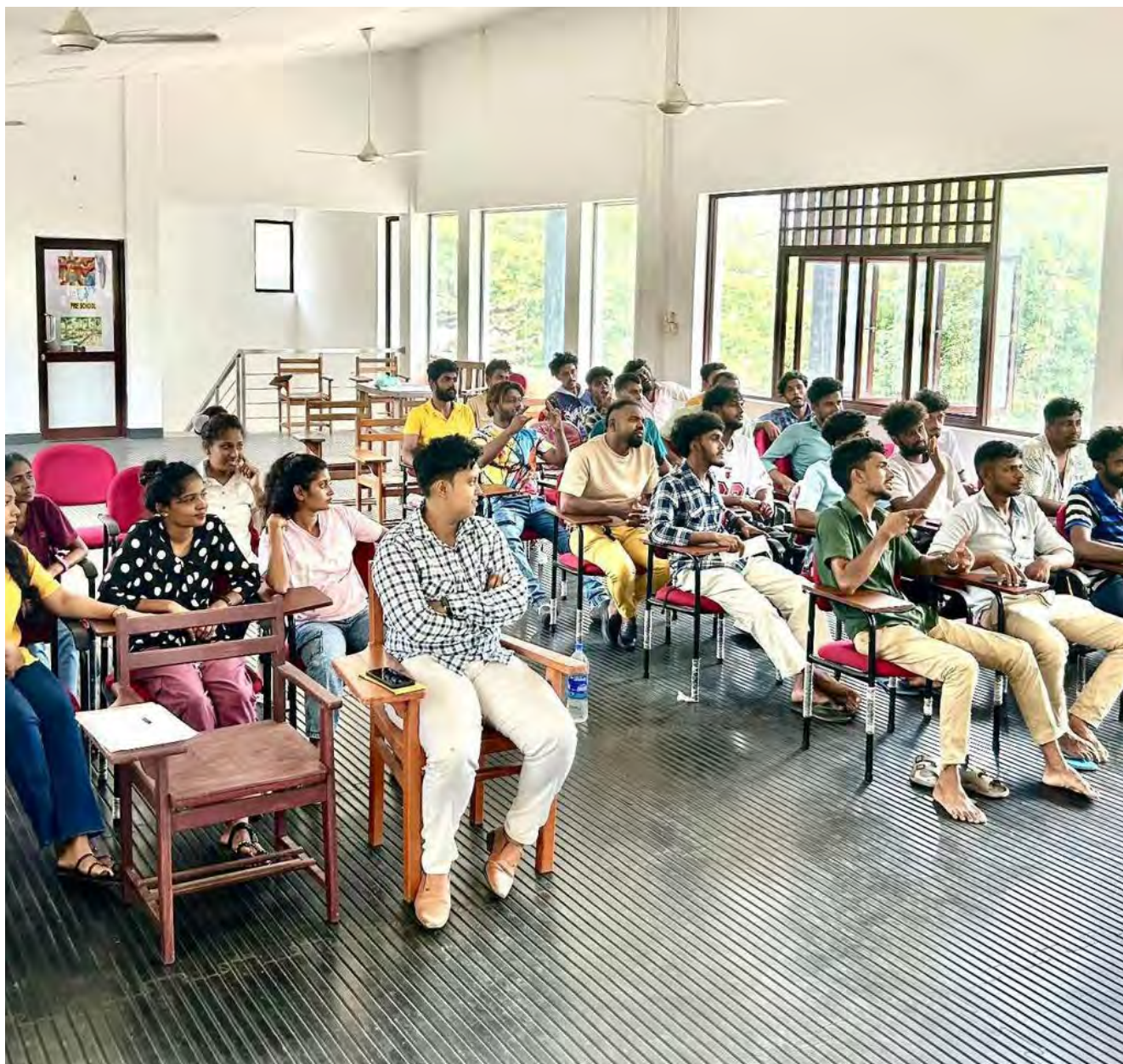
I Gampaha, Sri Lanka introducerade organisationen Deaf Youth Association (DYA) demokratiska och politiska begrepp för unga döva och teckenspråkiga under en workshop.

Under året har ungefär 44 personer från 20 projektgrupper från MyRights medlemsorganisationer varit aktiva. I projektgrupperna är det oftast personer med egna funktionsnedsättningar som arbetar och engagerar sig i projektet, ofta ideellt.