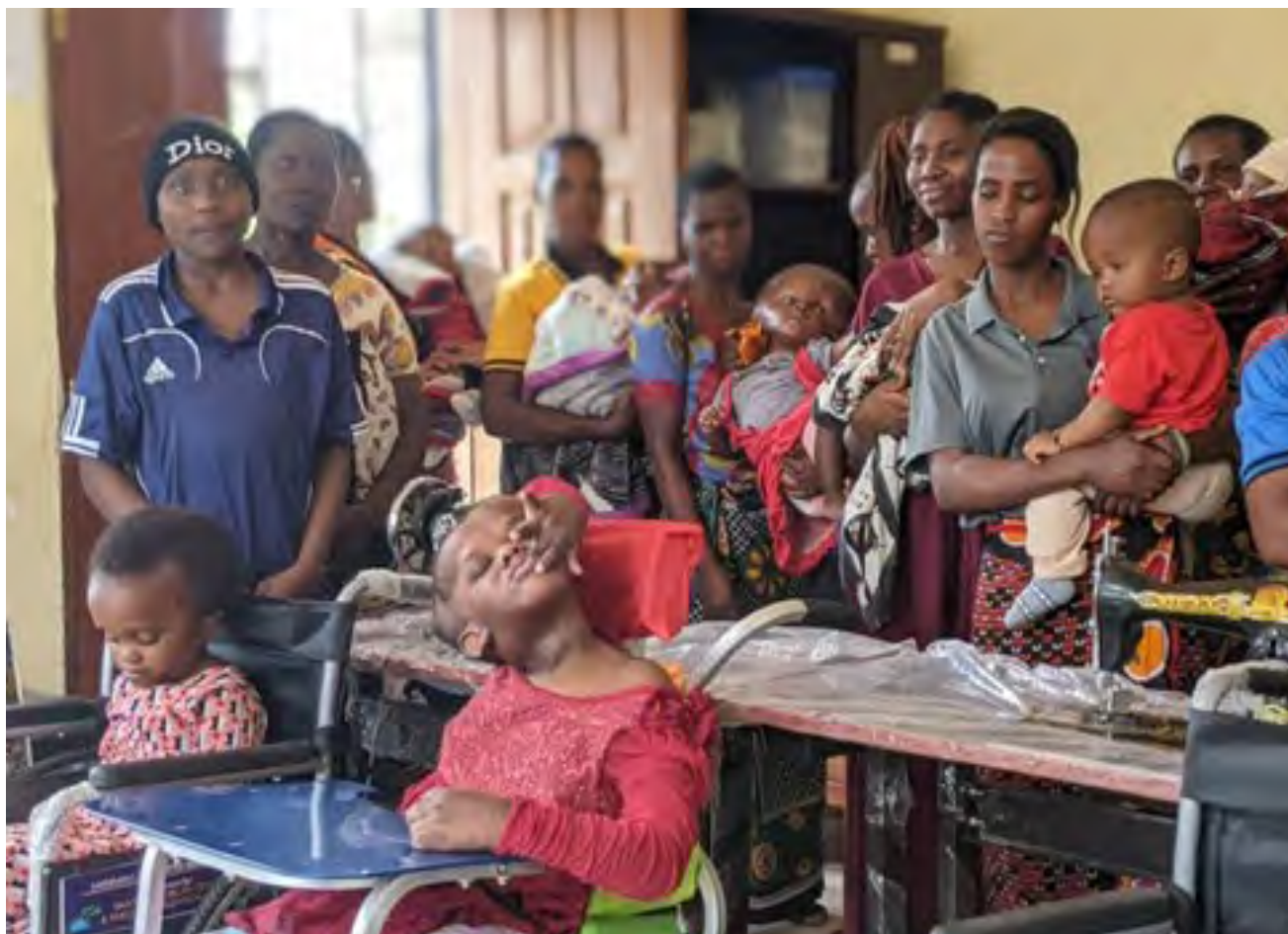
Föräldrar och barn med hydrocefalus på House of Hope inom partnerorganisationen ASBAHT:s verksamhet.