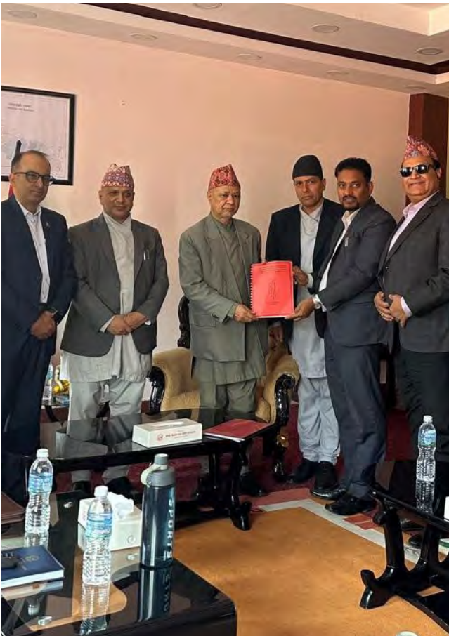
National Federation of the Disabled Nepal (NFDN) överlämnade en rapport till utbildningsminister Raghuj Pant.

ordna arbetet med nationella riktlinjer för personer med funktionsnedsättning tillsammans med åtta regionala och flera nationella federationsorganisationer. Funktionsrättsrörelsen i Bolivia har länge haft svårt att stå enad och samarbeta, men detta projekt har visat att det är möjligt. Genom ett öppet och samordnat arbete har FECOPDIS kunnat ta ansvar för att samla federationen och driva processen framåt. Initiativet resulterade i ett inkluderande politiskt forum där presidentkandidater bjöds in att presentera konkreta förslag på hur de aktivt ska arbeta med funktionsrättsfrågor, vilket stärkte rörelsens röst i valrörelsen.