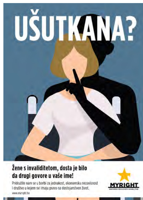
Kampanjbanner för kampanjen Silenced.

Årets arbete kulminerade i en nationell konferens: "The Voice of Women with Disabilities – We Are Shaping the Future Together". Där samlades kvinnor från hela landet för att diskutera ledarskap, delaktighet och vägar till inflytande. Konferensen visade tydligt hur ekonomisk egenmakt, psykosocialt stöd och gemenskap tillsammans skapar förutsättningar för verklig förändring.