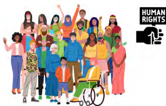
Ökad inkludering av personer med funktionsnedsättning

MyRight ger också stöd till funktionsrättsorganisationer för att de ska kunna stärka och utveckla sina organisationer. Detta innefattar normalt ett långsiktigt stöd för att ge kontinuitet i verksamheten och stöd till att utforma strategier för opinion och påverkan. Stödet är främst ekonomiskt men i samarbetet ingår också kapacitetshöjande insatser, såväl kring sakfrågor som kring administrativa och organisatoriska frågor. Målet är att stödet ska ge partnerorganisationerna ökad legitimitet med mandat och kapacitet att föra sina medlemmars talan.